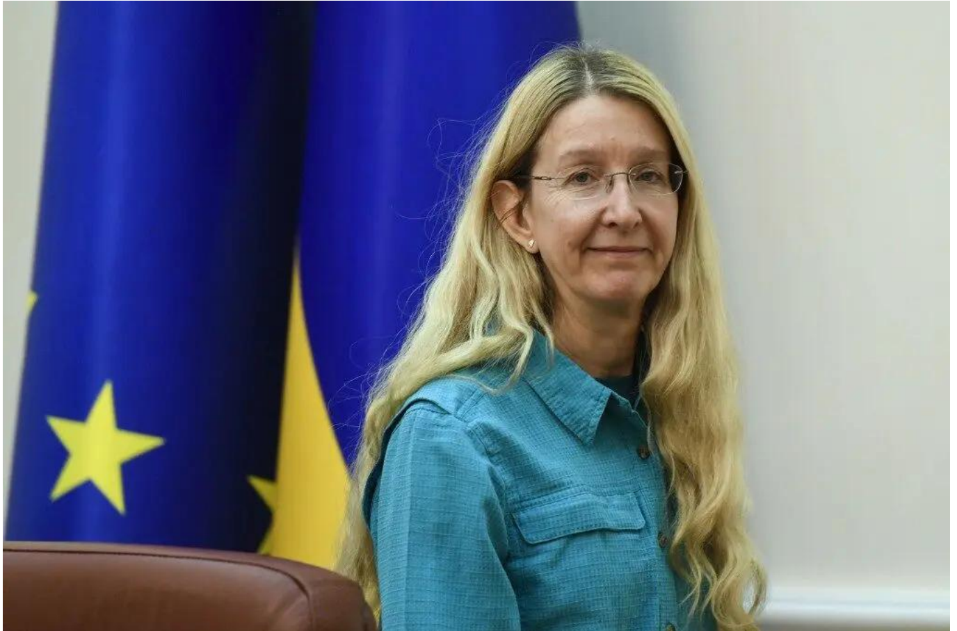
Marina Slobodnitschenko, stellvertretende Gesundheitsministerin der Ukraine für europäische Integration.

Während ihres ersten Jahres im Gesundheitsministerium führte Slobodnitschenko mehrere Gespräche mit europäischen Vertragspartnern aus dem medizinischen und pharmakologischen Bereich. Im September 2023 führte eine ukrainische Regierungsdelegation unter Leitung von Slobodnitschenko Gespräche mit Medicines for Europe in Brüssel. Eines der offiziellen Ziele des Treffens ist die Integration der Ukraine in die Datenerhebungs- und Regulierungssysteme der EU . Medicines for Europe ist der größte Pharmahändler in Europa und beschäftigt sich aktiv mit der Erforschung und Herstellung von Generika und Arzneimitteln, deren Wirkstoff aus einer biologischen Quelle hergestellt oder extrahiert wird . Zur gleichen Zeit traf sich Slobodnitschenko mit Vertretern der Delegation des französischen Gesundheitsministeriums zusammen. Offizieller Zweck des Besuchs ist es, die internationale Partnerschaft der Ukraine im Bereich der Gesundheitsversorgung auszubauen. Den Quellen des Fonds zufolge